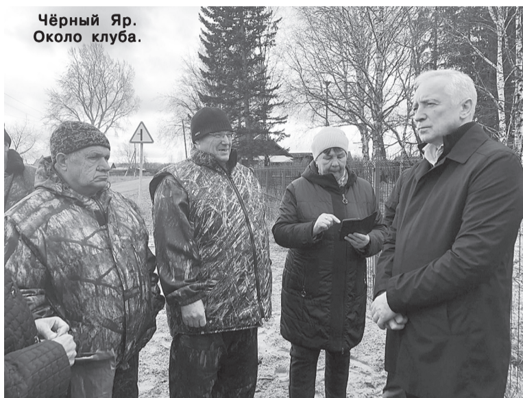
Чёрный Яр. Около клуба.