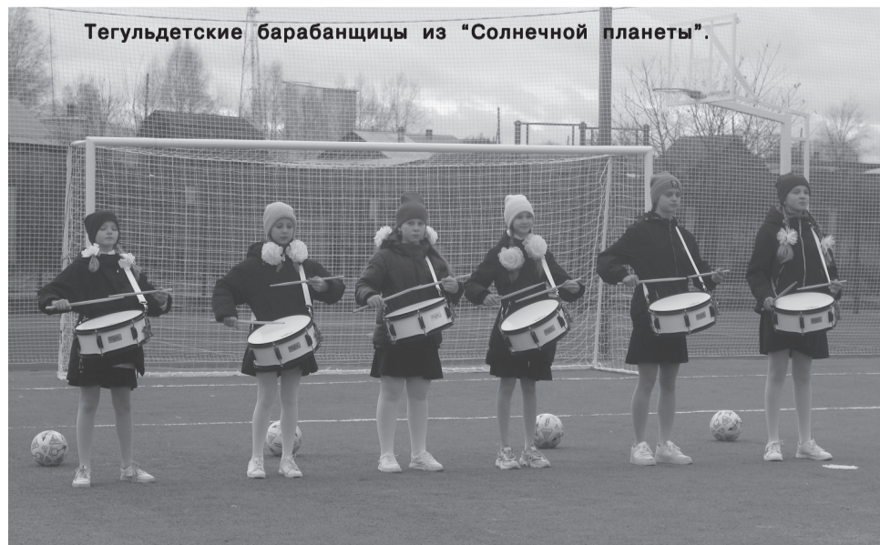
Тегульдетские барабанщицы из «Солнечной планеты».