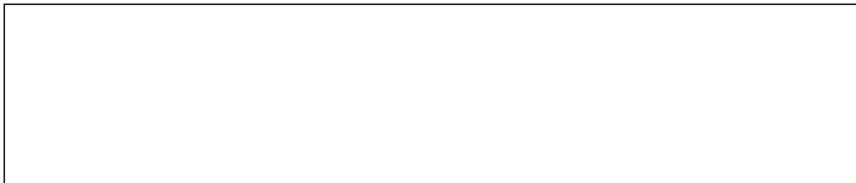
Схема границ проектирования